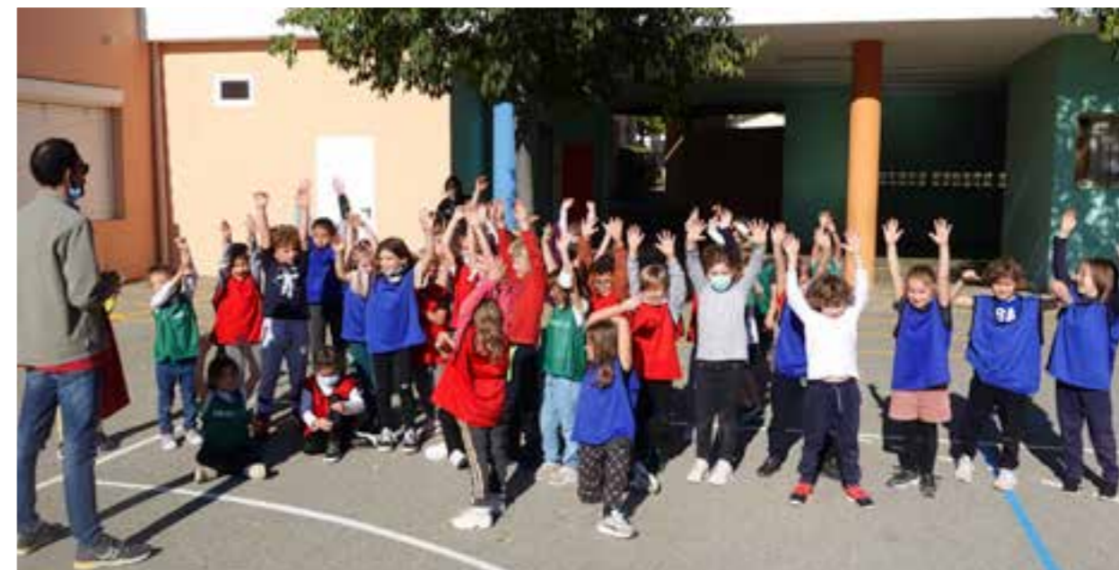
Les plus grands avaient investi la cour de l'élémentaire Vessiot pour s'adonner à des jeux en extérieur.