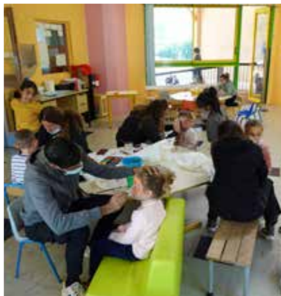
Les vacances de la Toussaint ont débuté par un atelier maquillage pour les plus petits au centre aéré.