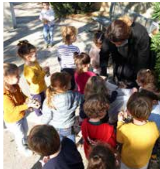
Ramassage de feuilles d'automne dans le parc d'Albertas pour les plus petits au centre aéré.