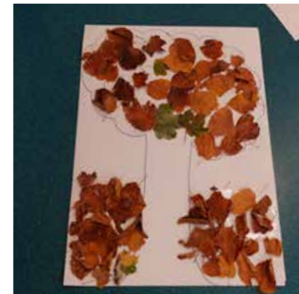
Les tableaux, résultant de ces travaux manuels, seront ensuite exposés dans le hall de l'école maternelle Vessiot.