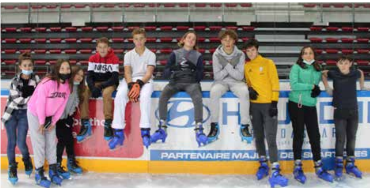
Durant les vacances de la Toussaint, les ados de la MDJ profitent de nombreuses activités sportives. Escalade, trottinette et patinoire étaient au rendez-vous.