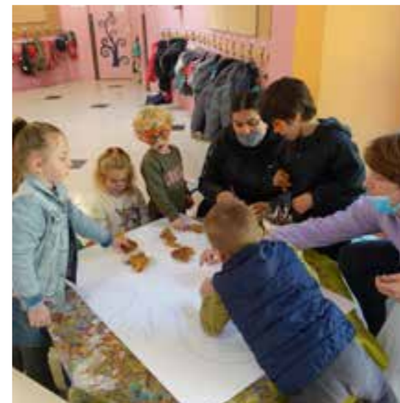
Les feuilles ramassées la veille sont ensuite collées sur des grandes feuilles cartonnées.