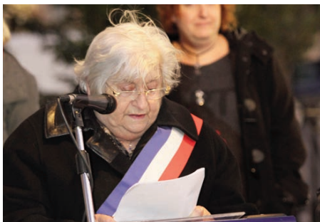
Commémoration pour les guerres en Afrique du Nord - 6 décembre