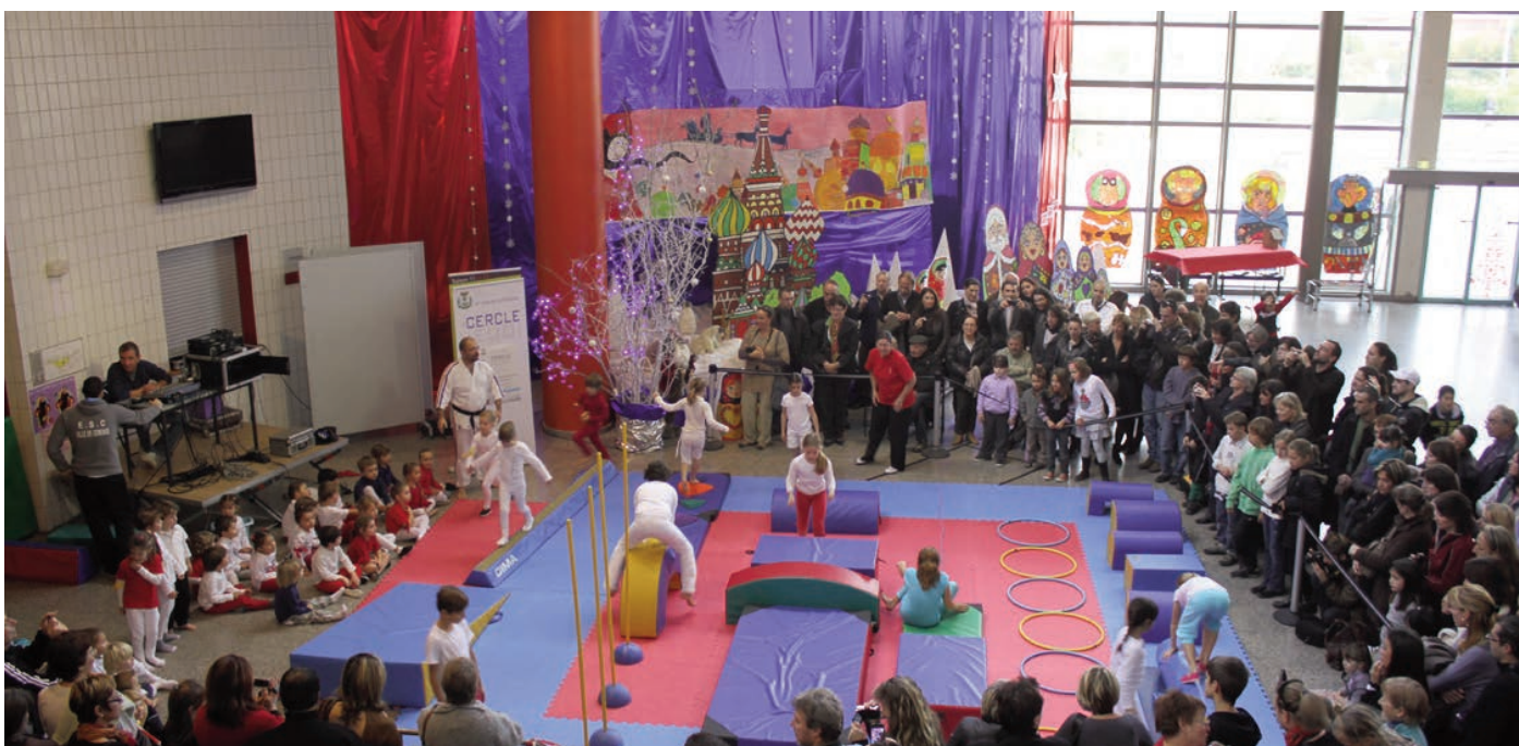
Noël à l'Espace Sport et Culture - 14 décembre