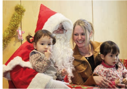
Distribution des cadeaux à la crèche du Parc d'Activités - 12 décembre