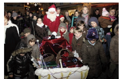
La Magie de Noël 17 décembre