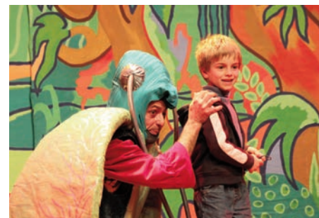
Spectacle de Noël "La Licorne aux Larmes d'or" - 15 décembre