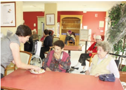
Mas des Aînés 14 décembre