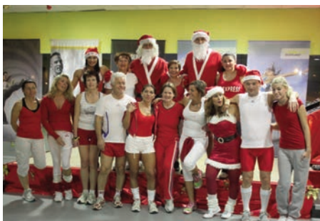
Cours de Noël à l'Espace Forme de l'AVL - 12 décembre