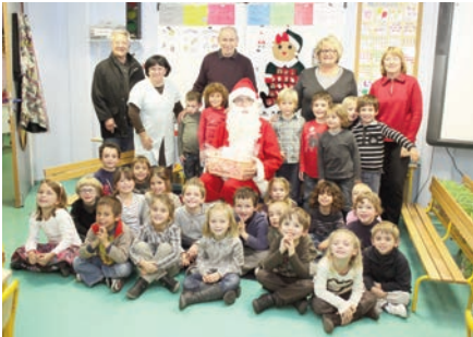
Distribution des cadeaux à la maternelle La Culasse - 13 décembre