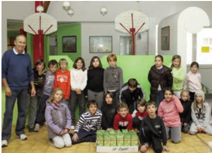
Ecole primaire La Culasse 16 décembre