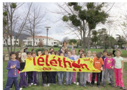
Téléthon à l'école primaire Vessiot 2 décembre