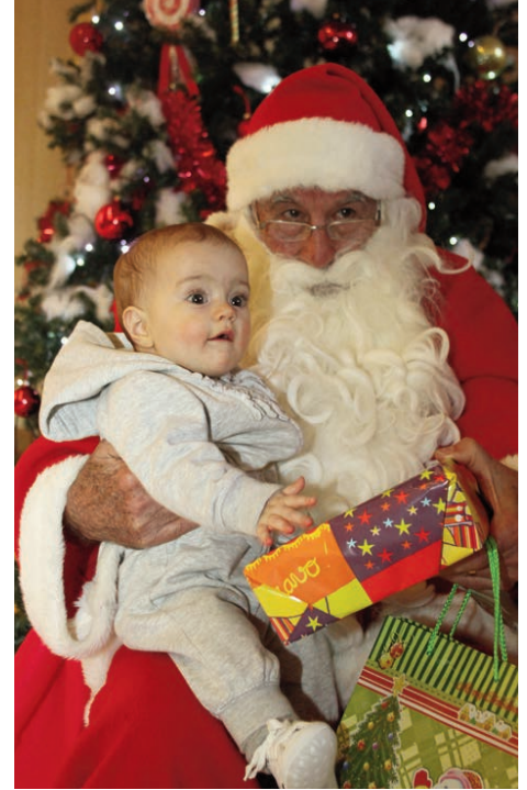
Distribution des cadeaux à la crèche Silky Giraldi - 14 décembre