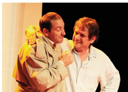
Oh bonne mère ! Mon frère est parisien 2 décembre