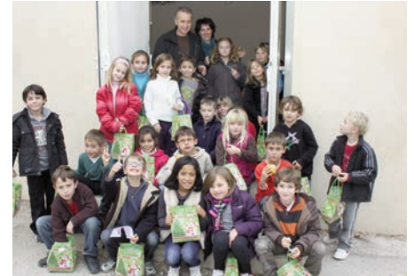
Ecole primaire Vessiot 13 décembre