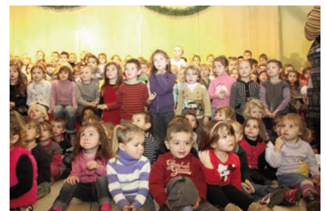
Chorale de la maternelle Vessiot 16 décembre