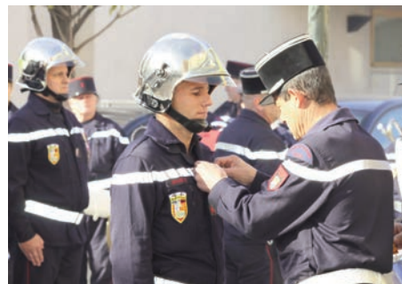
Cérémonie de la Sainte-Barbe 10 décembre