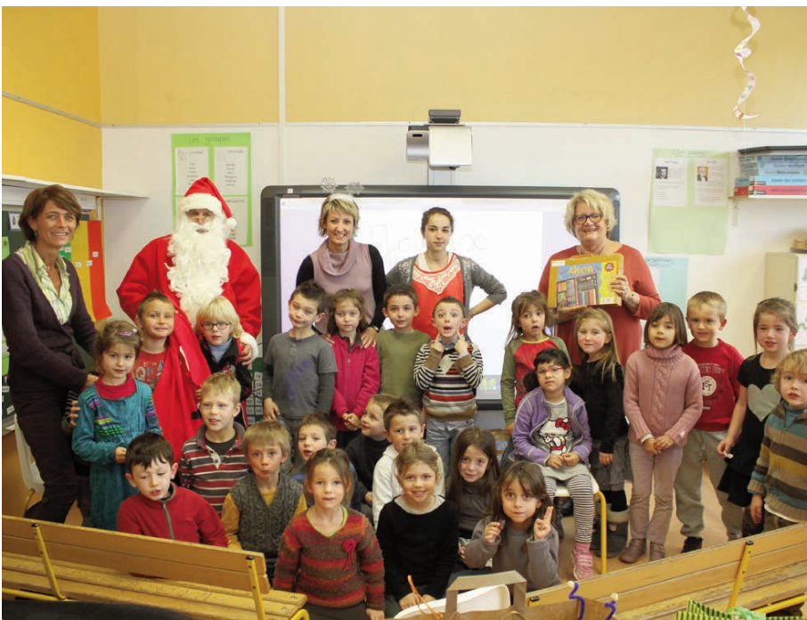
Distribution des cadeaux à la maternelle Vessiot 15 décembre