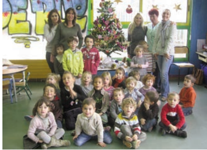
Académie du mercredi 14 décembre